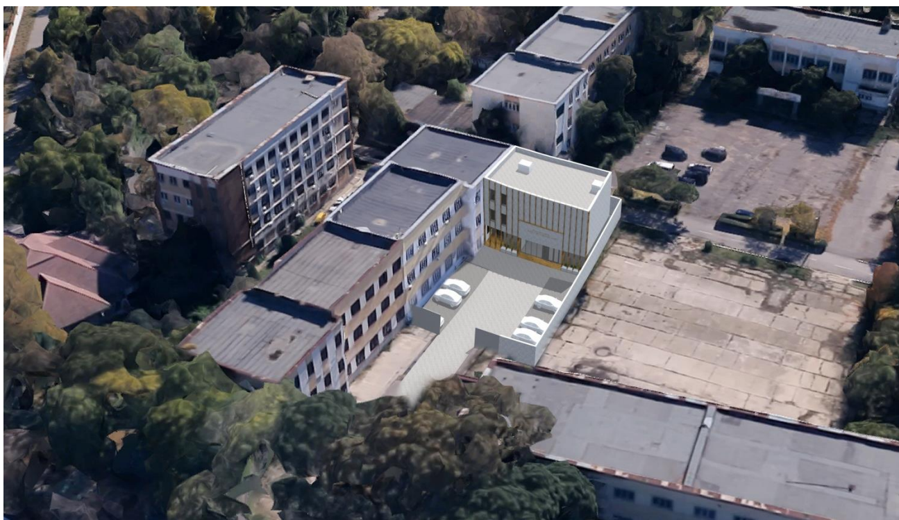
Figura 3 – Incadrarea construcției propuse în contextul urbanistic actual